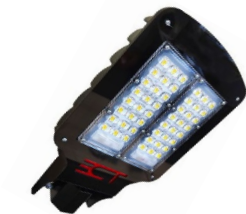
а) ЭСТ К-Магистраль-ШЗ