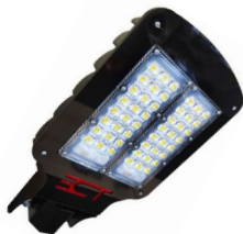
а) ЭСТ К-Магистраль-Ш2