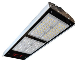
б) ЭСТ К-Магистраль-ШЗ

Корпус светильника выполнен из алюминия с анодированным или полимерным покрытием.